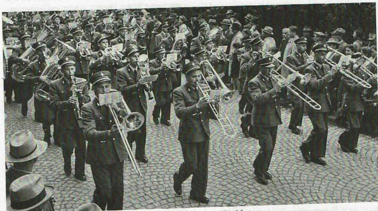
Musikgesellschaft Muri in der dritten Uniform anlässlich eines Musikfestes.