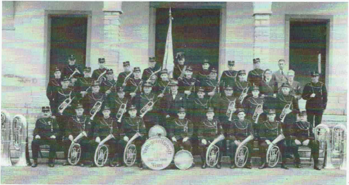
Die Musikgesellschaft Muri im Jahre 1946 vor der Pfarrkirche.