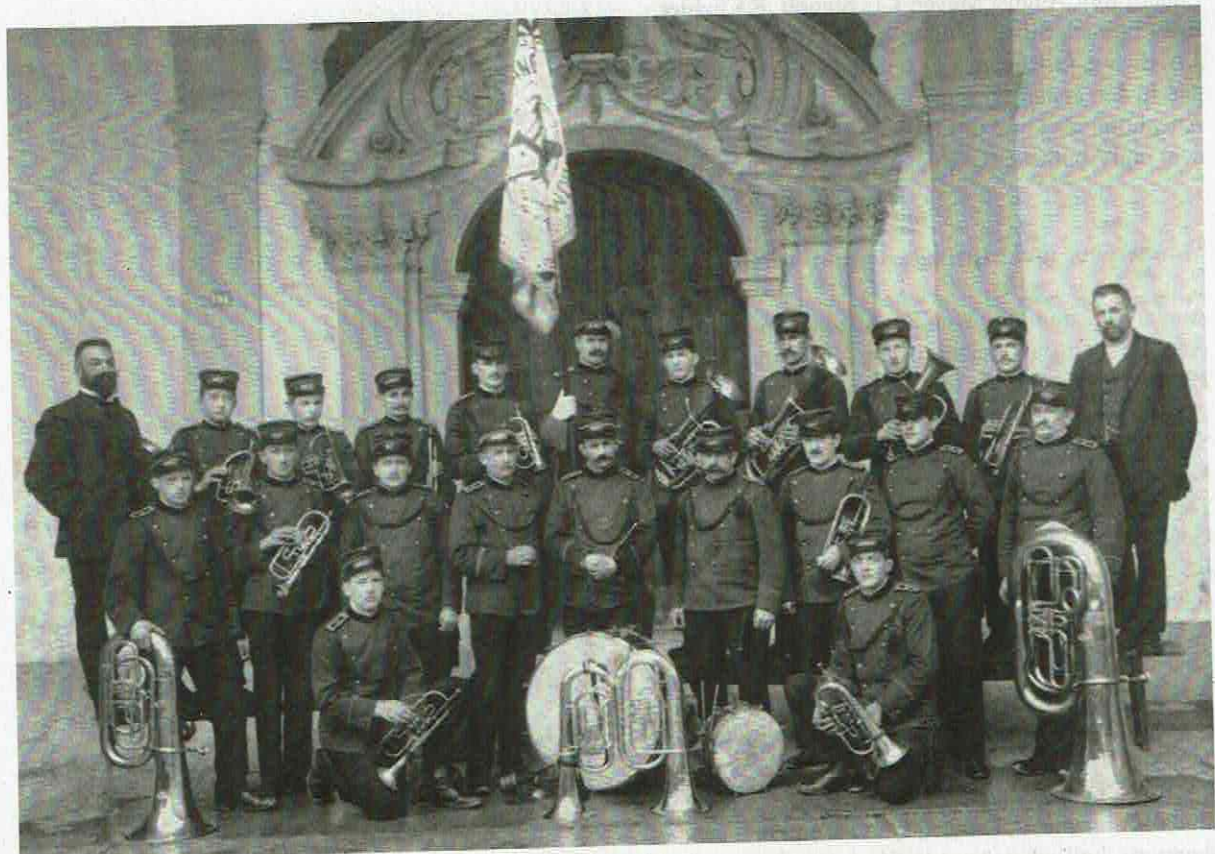
Die Musikgesellschaft Muri im Jahre 1921 vor der Klosterkirche.

Die seit 21 Jahren nicht mehr stattgefundene Firmung gab den Anlass zur Neugründung im Jahre 1886. Unter der Leitung von Direktor Speidel und unter dem alten Namen «Feldmusik» schien der Verein nach all den Schwierigkeiten aufzublühen. Er entwickelte eine emsige Tätigkeit: Beitritt in den im gleichen Jahr gegründeten Aargauischen Musikverband, Teilnahme am Musikfest in Aarau 1887 und Durchführung des ersten Aargauischen Musiktages in Muri 1888. Am 30. Dezember 1888 brachte der Basar einen Reingewinn von 500 Franken ein, der den Kauf von Instru-