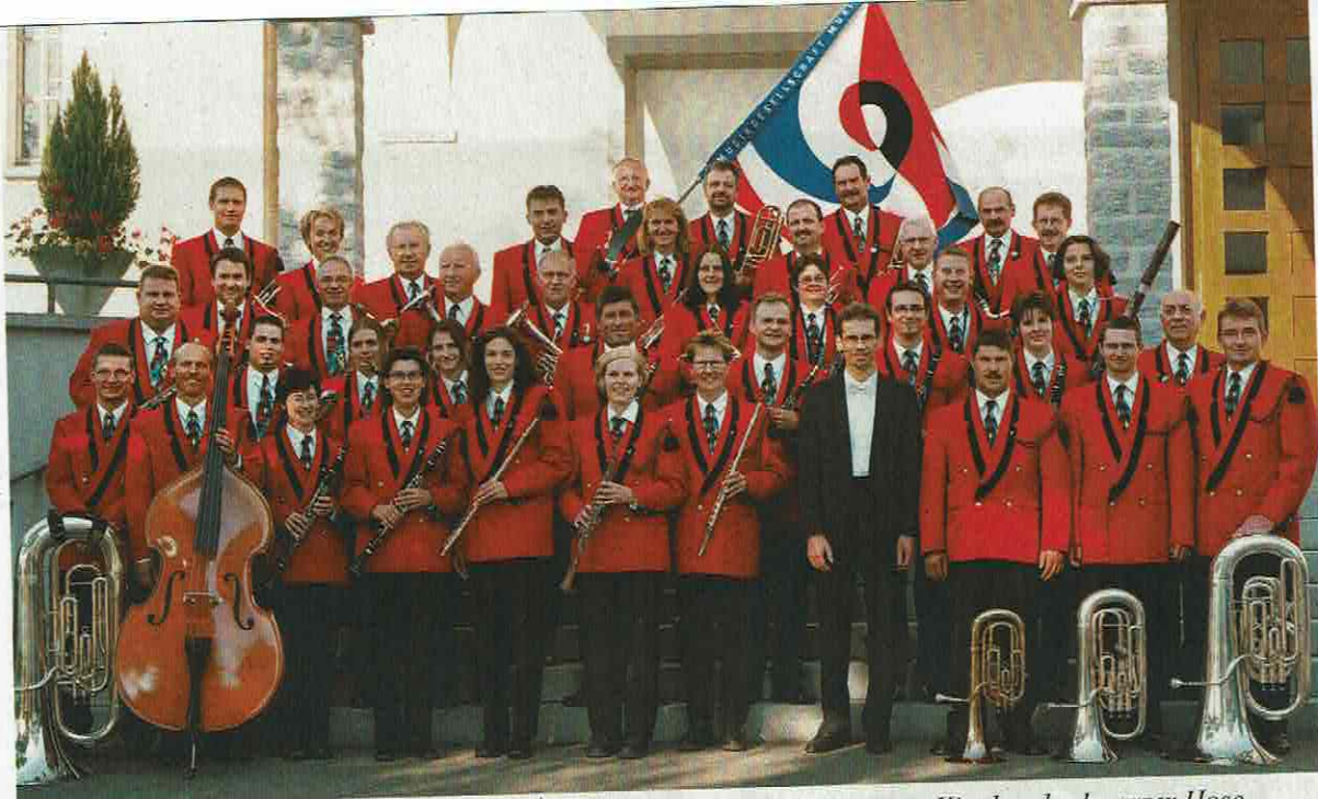
Im Jahre 1995 erhielt die Musikgesellschaft Muri eine neue Uniform mit rotem Kittel und schwarzer Hose.

werden. Infolge Schliessung des Adlersaales und Umbau des Festsaaes fand das Jahreskonzert 1989 in der Dreifachturnhalle Bachmatten statt. In diesem Jahr wurde der Musiktag in Bünzen besucht und bei der Einweihung des neuen Murianer Fussballplatzes durfte der Verein erstmals auf dem neuen Rasen spielen. Im Dezember lud die Musikgesellschaft Muri erstmals zu einem feierlichen Konzert mit dem Titel «Abendmusik zum Advent» in die Pfarrkirche ein.