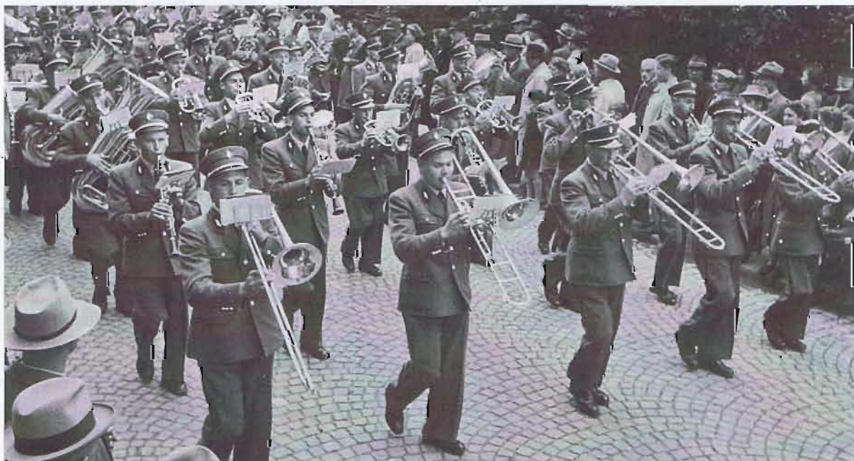
Musikgesellschaft Muri in der dritten Uniform anlässlich eines Musikfestes.