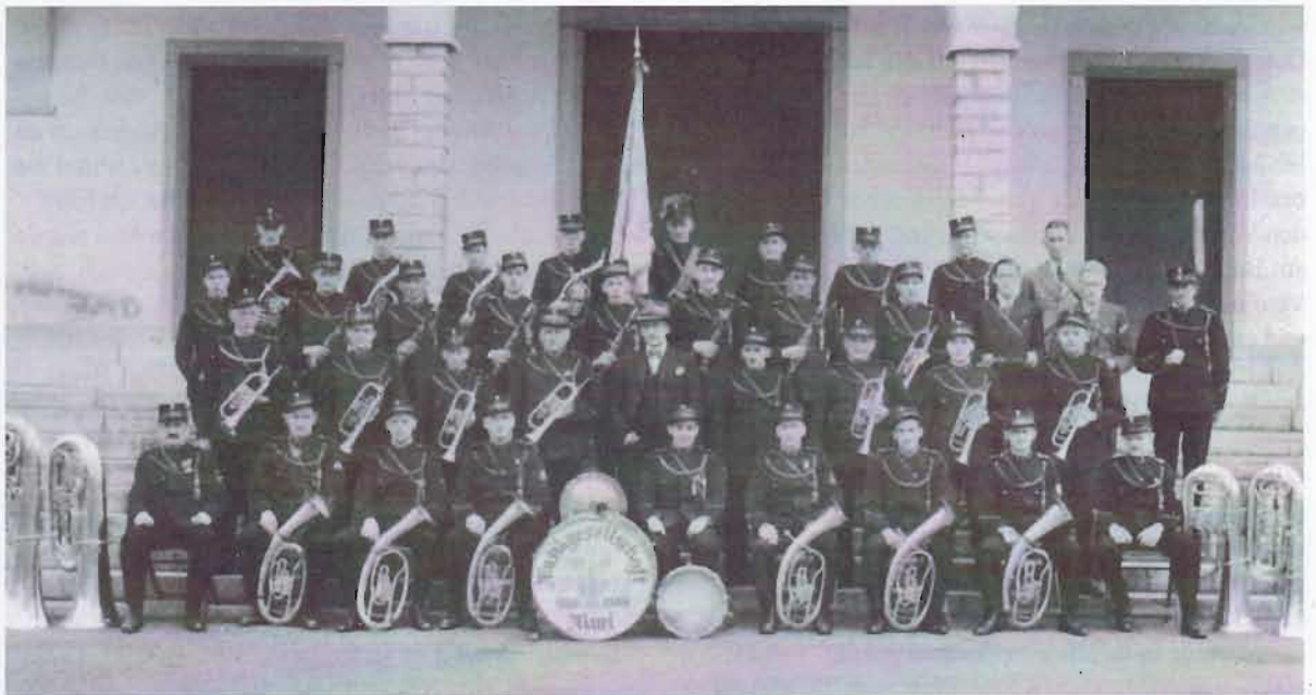
Die Musikgesellschaft Muri im Jahre 1946 vor der Pfarrkirche.