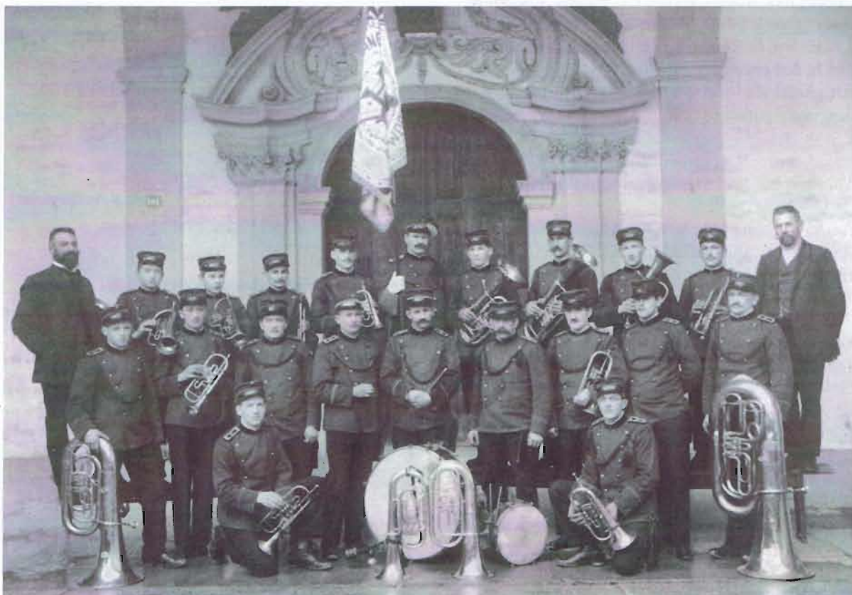
Die Musikgesellschaft Muri im Jahre 1921 vor der Klosterkirche.