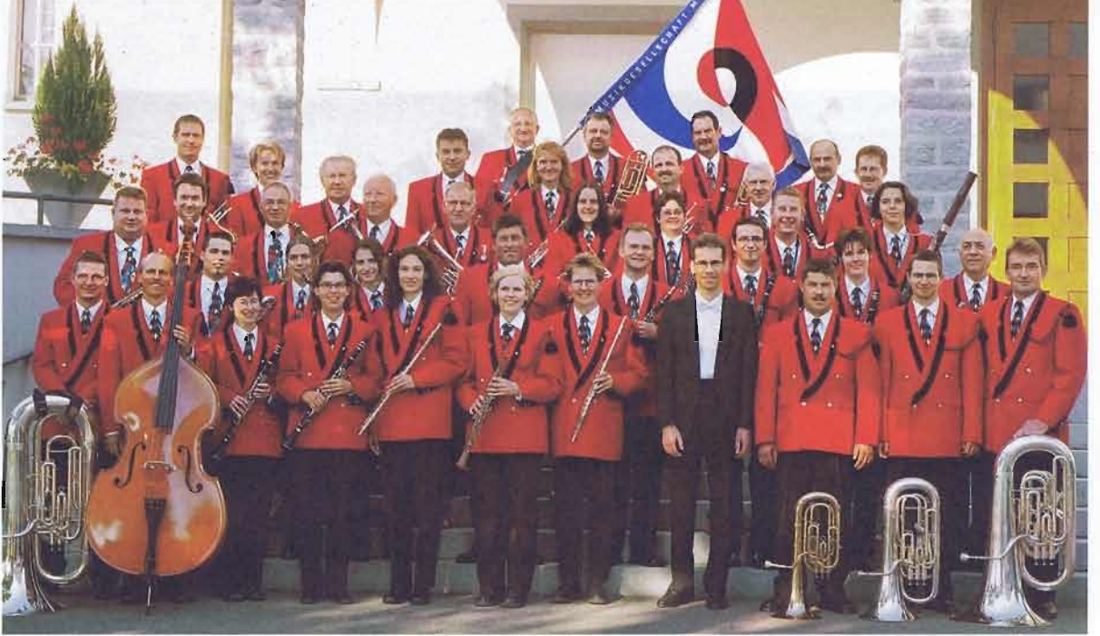
Im Jahre 1995 erhielt die Musikgesellschaft Muri eine neue Uniform mit rotem Kittel und schwarzer Hose.

werden. Infolge Schliessung des Adlersaales und Umbau des Festsaaes fand das Jahreskonzert 1989 in der Dreifachturnhalle Bachmatten statt. In diesem Jahr wurde der Musiktag in Bünzen besucht und bei der Einweihung des neuen Murianer Fussballplatzes durfte der Verein erstmals auf dem neuen Rasen spielen. Im Dezember lud die Musikgesellschaft Muri erstmals zu einem feierlichen Konzert mit dem Titel «Abendmusik zum Advent» in die Pfarrkirche ein.